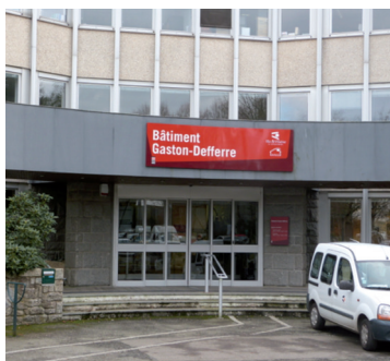
Bâtiment accessible aux personnes handicapées.

Quartier de Beauregard 13, avenue de Cucillé RENNES (35) Tél. : 0 800 35 35 05